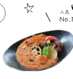
真野屋自家製の薬膳カレー Manoya homemade curry