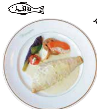
本日のお魚セット Today's fish set