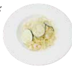
えびとズッキーニの塩こうじ レモンクリームパスタ Shrimp and Zucchini with SHIOKOUJI Lemon