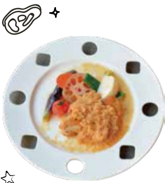
本日のお肉セット Today's meat set