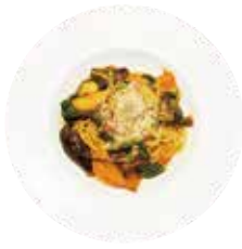
野菜たっぷりナポリタン Toamto sauce with Vegetables Pasta

自家製のミートソーススパゲッティーニです。 手作りにこだわった真野屋の自慢です！