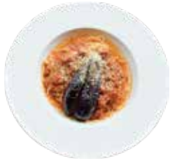
手作りミートソーススパゲッティーニ Homemade Meat sauce Spaghetti