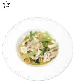
豚肉と野菜のごま ペペロンチーノ Pork and vegetables with Sesame peperoncino Pasta

ベーコン研究家が作る自家製ベーコン。 噛むほどに旨味が味わえる自慢のパスタです。