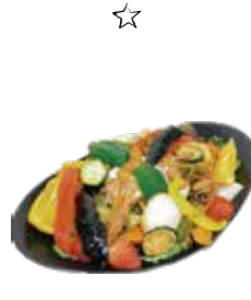
ボリューム満点パワーサラダ Power salad