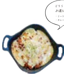
自家製ミートドリア・カレードリア "Meat Doria" or "Curry Doria"