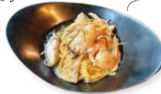
大粒牡蠣のペペロンチーノ Peperoncino with large oysters