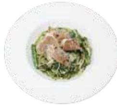
生ハムと大葉のジェノベーゼパスタ Prosciutto with OHBA Genovese Pasta

自家製で一から手作りしたナポリタンソースと たっぷり野菜が絡み、くせになるパスタです。