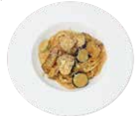
自家製ベーコンとナスの トマトクリームパスタ "Homemade Bacon and eggplant Tomato cream Pasta

復活！！大人気のパスタ。塩こうじとレモンを 合わせているのでさっぱりした食べやすいパスタです。